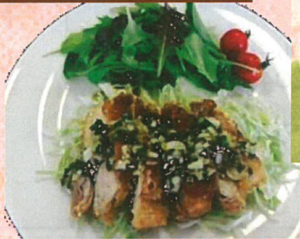
鶏のから揚げ（油淋鶏ソース）