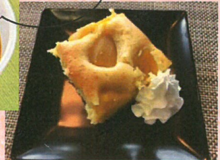
マンゴー缶とヨーグルトのケーキ